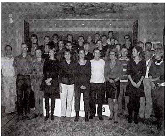
On pose pour la photo